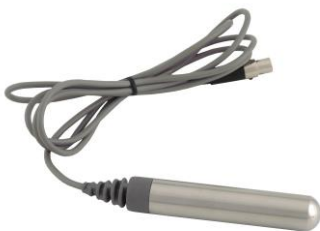
в) нейтральный электрод №1