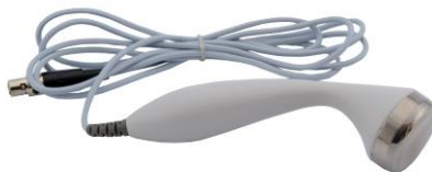
б) рабочий электрод «тело»