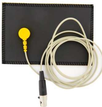
г) нейтральный электрод №2