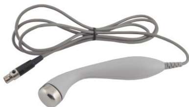
а) рабочий электрод «лицо»